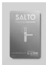
RFID kort NXP MIFARE®