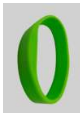
Armband av silikon NXP MIFARE®